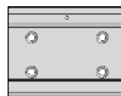
44 mm DIN-Rail 導軌固定架